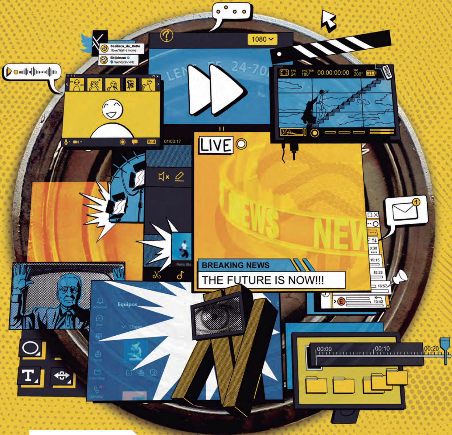
Imagen: Richard Tixi