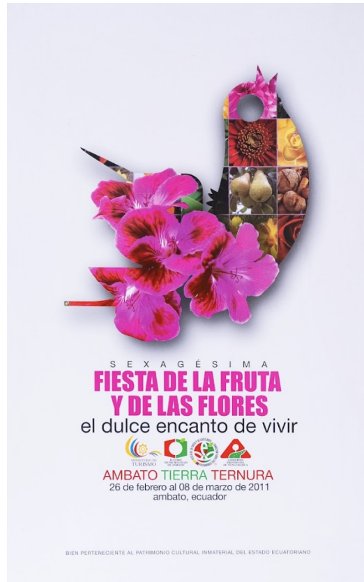
Figura 2. Cartel oficial de la FFF del año 2011. Fuente: Comité Permanente de la Fiesta de las Frutas y de las Flores.

En la categoría de contacto se observó que los elementos que captan la atención del receptor ocupan al menos el 50% del cartel, y se ubican principalmente en la parte central. Estos elementos suelen estar conformados por colores intensos e ilustraciones llamativas. Un ejemplo claro se encuentra en el cartel del año 2011, donde la figura más reconocible es un collage en forma de colibrí que se sitúa en el centro de la composición, generando contacto inmediato con el espectador (Figura 2).