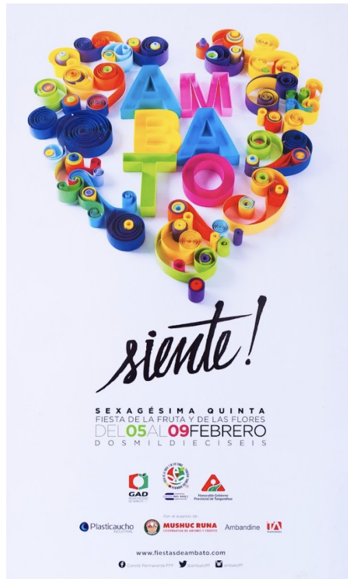
Figura 5. Cartel oficial de la FFF del año 2016.