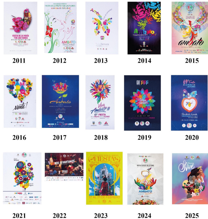
Figura 1. Carteles oficiales de la FFF.