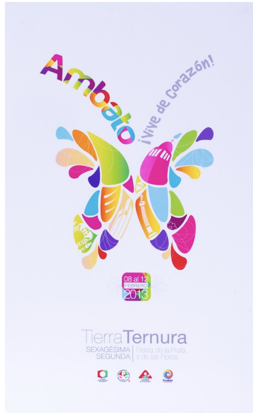
Figura 3. Cartel oficial de la FFF del año 2013.

cartel de 2013, que incorpora claramente información de la festividad en un recuadro, ubicado debajo de la ilustración de la mariposa y en la misma gama cromática, un texto que consigna de manera clara la fecha y año de la festividad (Figura 3).