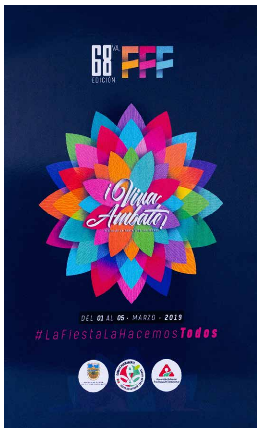
Figura 6. Cartel oficial de la FFF del año 2019.