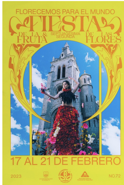
Figura 7. Cartel oficial de la FFF del año 2023.

persuasiva; la identidad se mantiene sin marcas externas, y se introduce un elemento innovador mediante el montaje de varias imágenes y el corte visual del monumento. En conjunto, la pieza exhibe una estética llamativa, con un juego tipográfico, curvas Art Nouveau y un fondo enérgico que potencian su impacto visual (Figura 7).