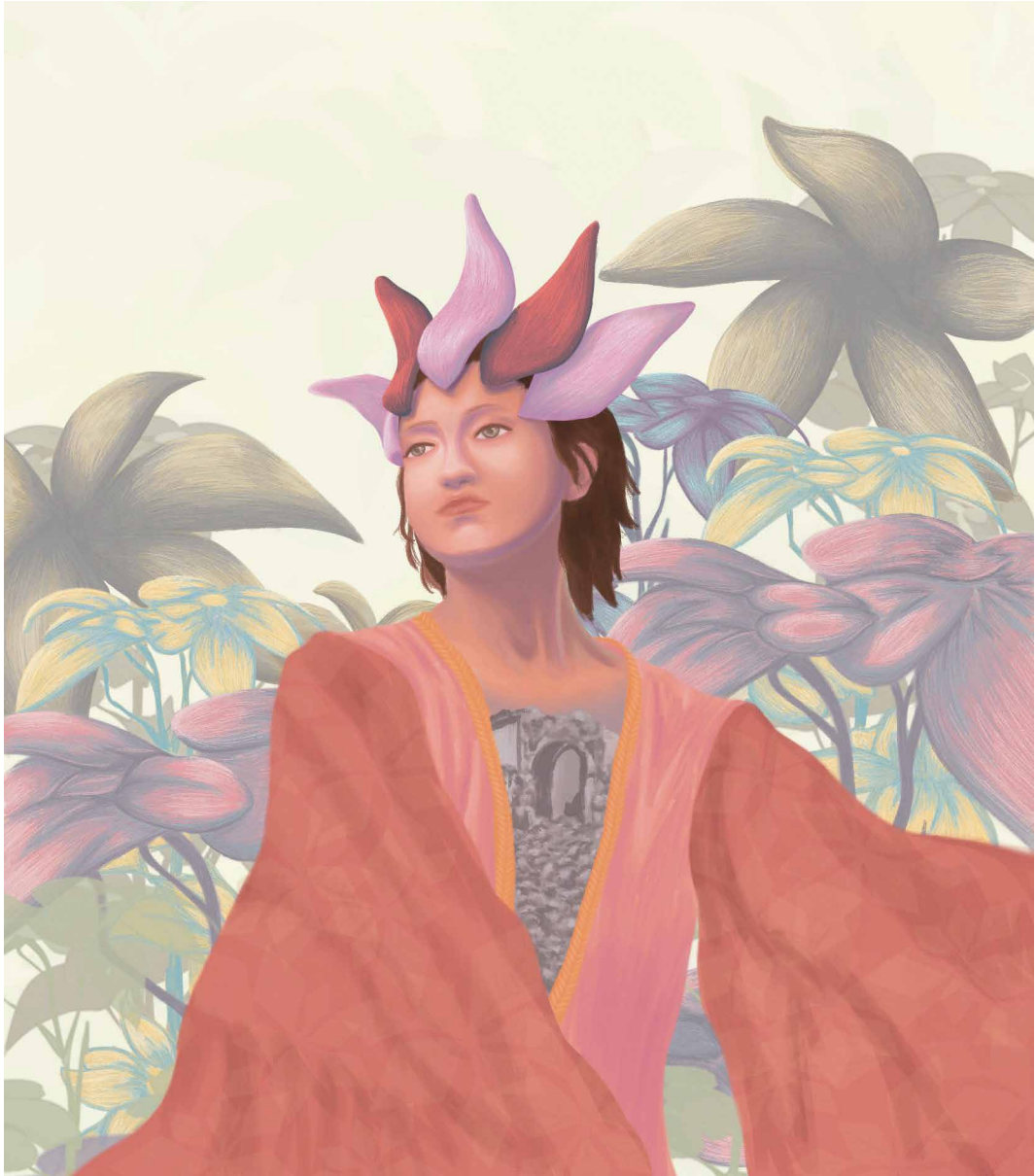
Imagen: Ashley Aviles