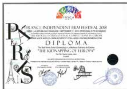
Figura 4. Diploma concedido al mejor guion.