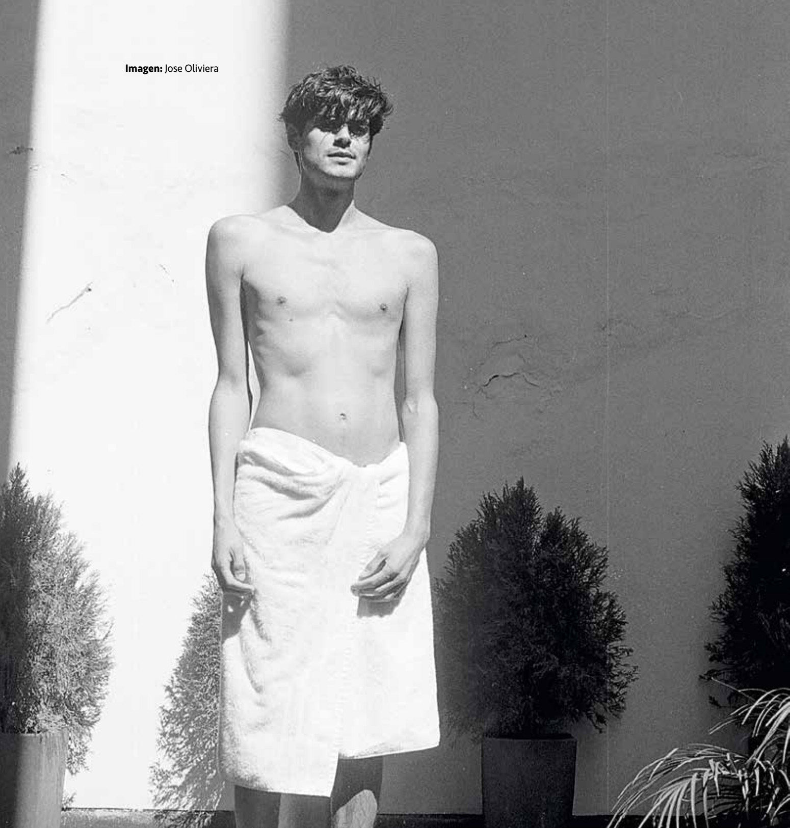
Imagen: Jose Oliviera