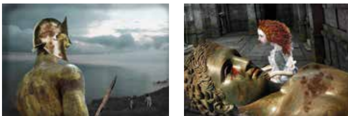
Figura 2. Talos

Talos fue fabricado a partir de las estatuas clásicas, lo cual le otorgaba un matiz simbólico, ya que su muerte dramática representaba el declive del esplendor milenar de Europa.