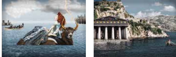
Figura 3. Escenas de Europa

A pesar de todo nuestro entusiasmo el proceso demoró un buen tiempo, pero finalmente el corto quedó armado. La nostálgica música dark acompañaba el viaje de Europa a través del mar y la subversiva labor de los forasteros que aniquilaban a Talos. Ya solo faltaba poner los créditos.