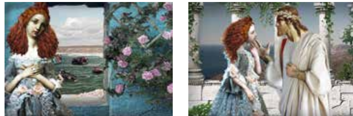
Figura 1. Zeus y Europa

Alla Kodratova Escuela Superior Politécnica del Litoral Guayaquil, Ecuador akondrat@espol.edu.ec