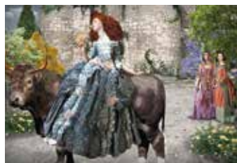
Figura 5. Otra escena de Europa .

Después de su ejecución, la cotidianidad se hizo presente al instante, en forma de un correo masivo convocando a todos los docentes del área a una reunión, a lo cual se sumó el mensaje de mi hijo: "mami, cómprame tres cuadernos de cuadros". El reloj recordó que en quince minutos comenzaba mi clase, así que dije: "¡adiós Europa , gracias de corazón!", y eso fue todo.