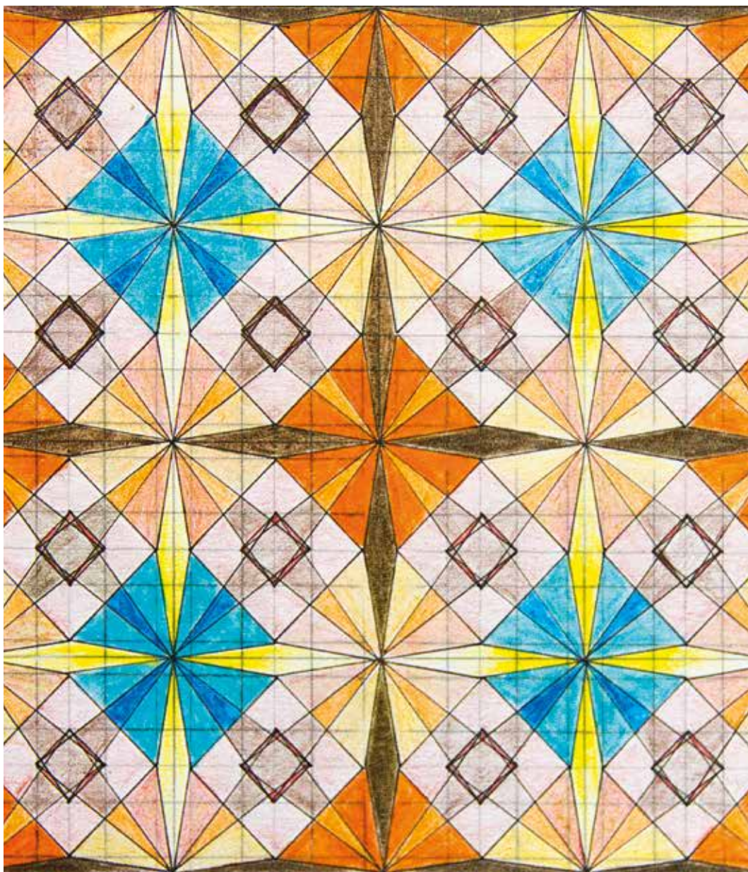
Imagen: Ericka Sánchez