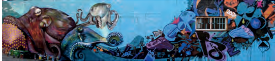
Figura 3. Octopus II (Lahe y Srg 2007). Este mural obtuvo el primer premio del Concurso de Arte Joven, organizado por la Delegación de Juventud del Ayuntamiento de Sevilla.

(2006), la incluyó entre las poco menos de una docena de escritoras españolas, de un total de 130 de todo el mundo, que mostraba en sus páginas, siendo la única del sur de España. Esta publicación estaba estructurada en un apartado de graffiti y otro de street art , apareciendo en este último, en el que se remarcaba en el breve texto que acompañaba las imágenes la vinculación con los estudios artísticos y que, antes de iniciarse en el mundo del graffiti, ya venía desarrollando creaciones sobre lienzos (Ganz, 2006, 170). El hecho de aparecer en esta publicación nos indica el nivel alcanzado por la artista, a la vez que también hemos de señalar el poco espacio que tenían las mujeres en recopilaciones relativas al graffiti y arte urbano de aquellos momentos, donde no alcanzaban el 10% de los artistas incluidos en monografías de referencia como Graffiti World. Street Art from the Five Continents (Ganz, 2006), From Style Writing to Art (Magda Danysz, 2011) o World Atlas of Street Art and Graffiti (Rafael Schacter, 2013), configurándose como reflejos de una tendencia androcéntrica (Parisi, 2015, 54) 3 en torno a todo este fenómeno.