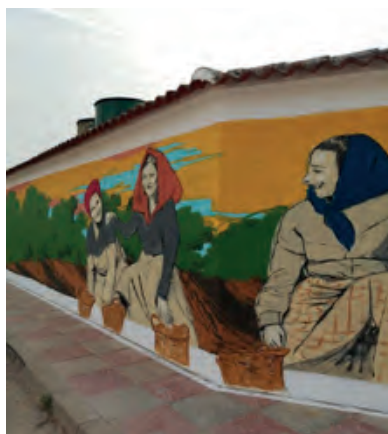
Figura 10. Detalle del proceso de Medio peón (Ana Langeheldt 2021).

Por otra parte, una producción que ahondaba en el proceso de plasmar la invisibilidad fue la realizada para el Palenciana Fest (Palenciana, Córdoba). Bajo el nombre de Medio peón (ver figura 10), se podía ver una composición con protagonismo de mujeres con trajes tradicionales en un descanso de la jornada de recolección de la aceituna, donde se venía a remarcar el concepto de sororidad en el ámbito rural (Subbéticahoy, 2021), escasamente puesto en valor hasta hace bien poco. Tanto en el mural del Ordes como en el de Palenciana el dibujo adquiriría un notable protagonismo, al igual que los brochazos, a modo de trazos, contribuían a remarcar el significado de las obras acercándolas a un lenguaje casi expresionista.