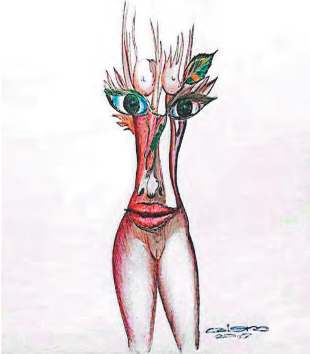
Imagen: Gabriel Calero